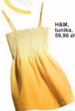
H&M, tunika, 59,90 zł