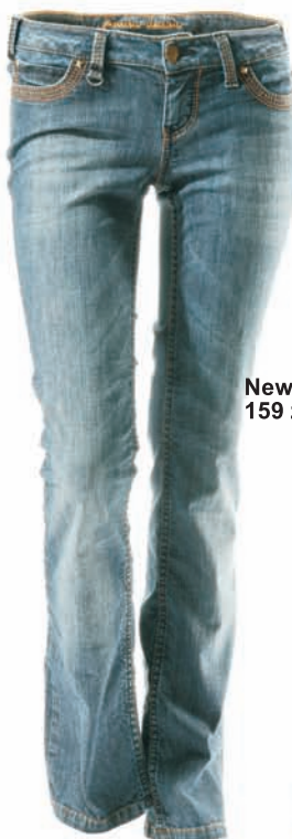
New Yorker, 159 zł