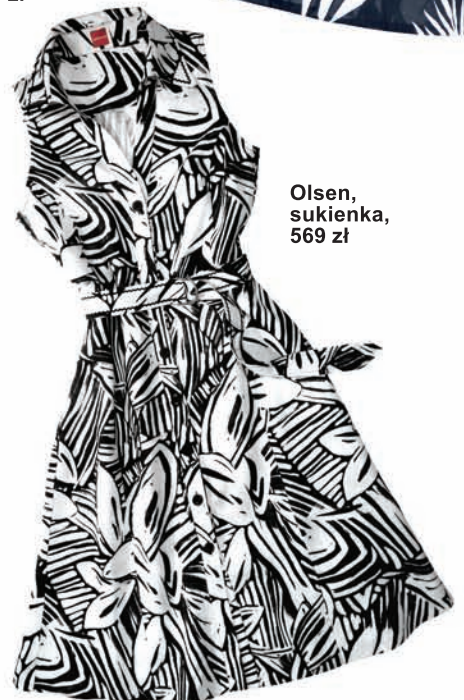
Olsen, sukienka, 569 zł