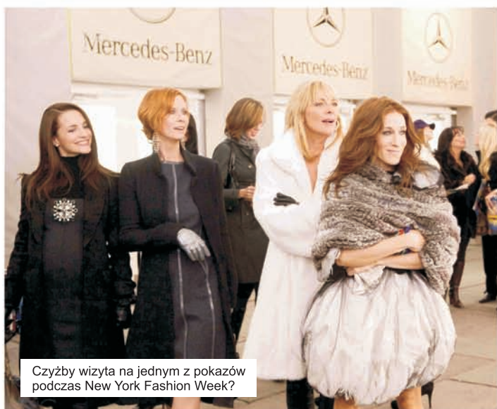
Czyżby wizyta na jednym z pokazów podczas New York Fashion Week?

I to w wielkim stylu. Jeszcze ładniejsze i oczywiście cudownie ubrane, a raczej wystylizowane. Szczególnie Carrie Bradshaw ( w tej roli Sarah Jessica Parker ) – szalona felietonistka, która próbuje rozgryźć nieodgadnioną naturę mężczyzn i kobiet, a po godzinach wędruje w poszukiwaniu nowej pary szpilek od Manolo Blahnika. Zobaczymy również Samanthe ( Kim Cattrall), której seksualne przygody czasem oneśmielają nawet jej przyjaciółki, szczególnie Charlotte (Kristin Davis). Ciekawe czy w kinowej wersji Miranda wyjdzie za męża za Steve'a, urodzi dziecko i przeprowadzi się na Brooklyn. Tego wszystkiego i wiele więcej dowiedzie się już 20 czerwca, ponieważ wtedy „Seks w wielkim mieście” pojawi się w polskich kinach.