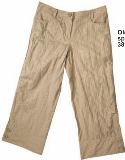
Olsen, spodnie, 389 zł