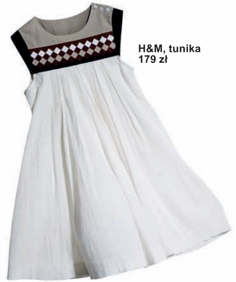
H&M, tunika 179 zł