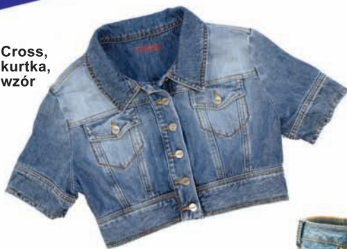
Cross, kurtka, wzór

Ciemny denim idealnie pasuje na wielkie wyjścia. Wystarczy, że dodasz wieczorowe dodatki: szpilki, kopertówkę i biżuterię.