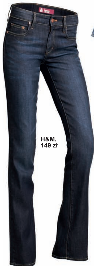
H&M, 149 zł