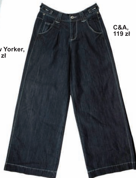
C&A, 119 zł