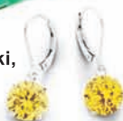
Apart, kolczyki, wzór