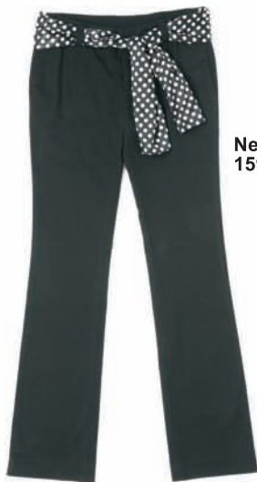
New Yorker, 159 zł