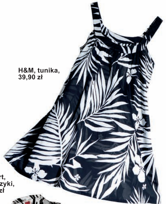
H&M, tunika, 39,90 zł