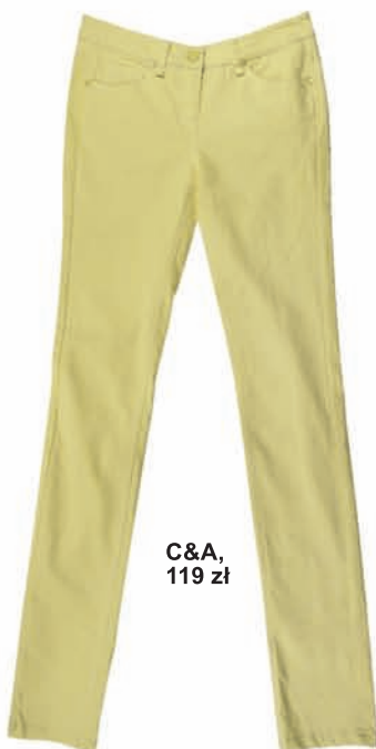
C&A, 119 zł