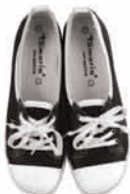
Tamaris, buty, 199,90 zł