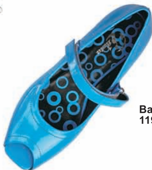
Bata, buty, 119 zł