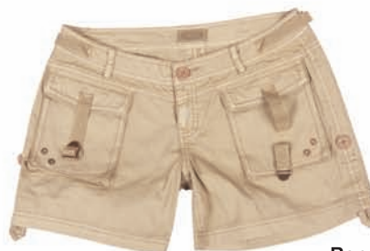
Reporter, szorty, wzór