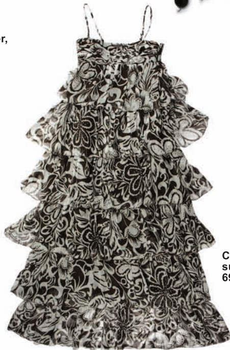
C&A, sukienka, 69,90 zł