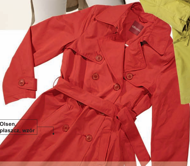
Olsen, płaszcz, wzór

N ie przemija nigdy. W kolejnych sezonach nieznacznie zmieniają się jego wzory i kolory, ale króluje od lat. Elegancko ubiera kobiety o niemal każdej sylwetce. Warto mieć w szafie przynajmniej dwa. Jeden z nieco grubszej tkaniny na jesień oraz z lżejszej na wiosnę i chłodne letnie poranki lub wieczory. W tegorocznych kolekcjach królują klasyczne kroje w pastelowych kolorach, ale jeśli masz odwagę możesz ubrać również neonowe barwy, np. żółty czy kobaltowy. Do biura polecamy stonowane odcienie beżu. Do tego dzinsy, T-shirt,