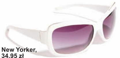
New Yorker, 34,95 zł