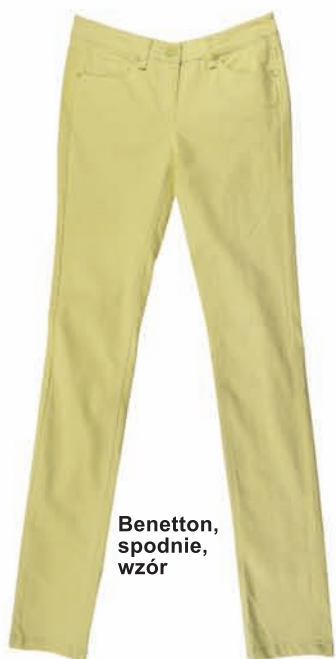
Benetton, spodnie, wzór