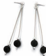
Apart, kolczyki, 129 zł