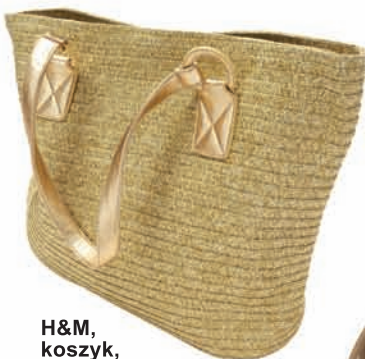
H&M, koszyk, 39,90 zł