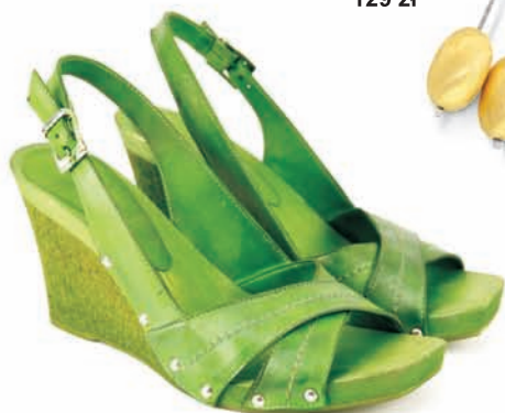
Venezia, buty, wzór