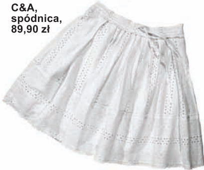
C&A, spódnica, 89,90 zł

J edno z najmodniejszych połączeń kolorystycznych w historii! Dedykowane Paniom, które nie przepadają za neonowymi barwami i kwiatowymi wzorami. Występuje w wersji eleganckiej – w klasycznych kostiumach, garniturach, biżuterii oraz luźniejszej na t-shirtach, sukienkach, a nawet butach. Ponadczasowe zestawienie dla mniej odważnych.