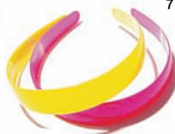
Fishbone, 7,95 zł