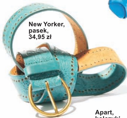
New Yorker, pasek, 34,95 zł