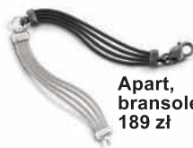
Apart, bransoletka, 189 zł