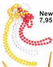
New Yorker, 7,95 zł