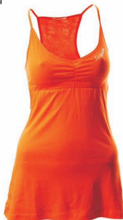
New Yorker, 29,95 zł