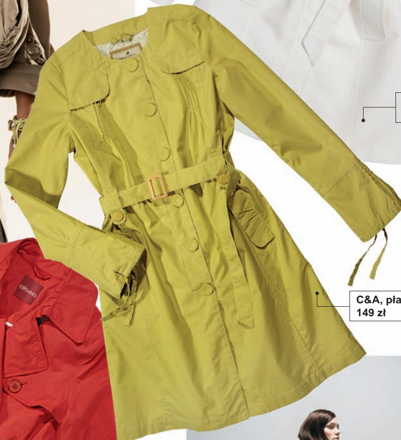
C&A, płaszcz 149 zł