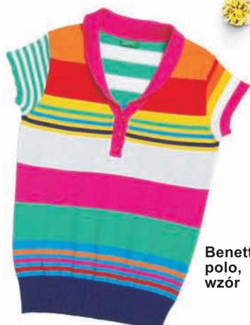
Benetton, polo, wzór