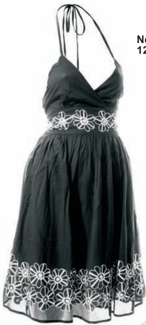
New Yorker, 129 zł