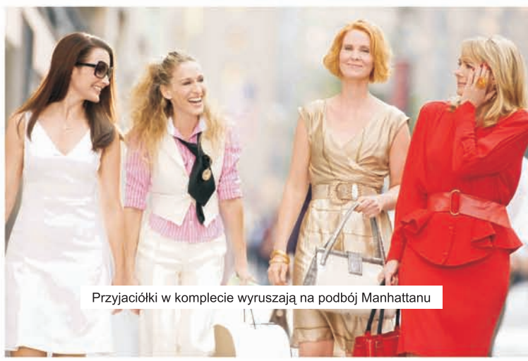
Przyjaciółki w komplecie wyruszają na podbój Manhattanu