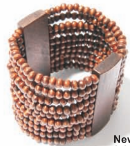
New Yorker, 9,95 zł