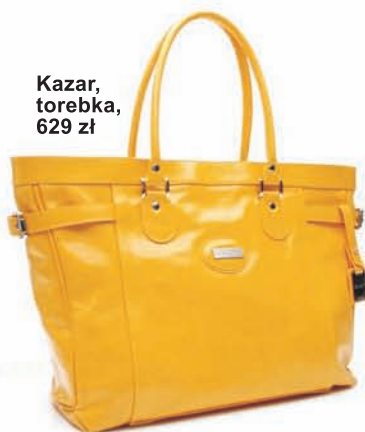
Kazar, torebka, 629 zł