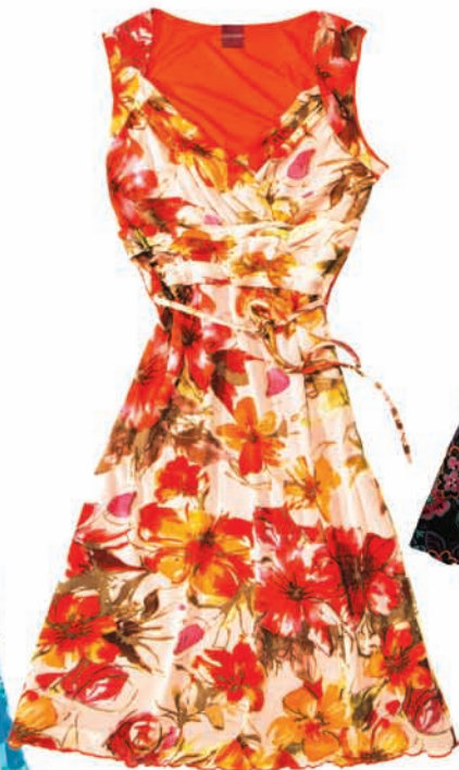
Olsen, sukienka, 369 zł