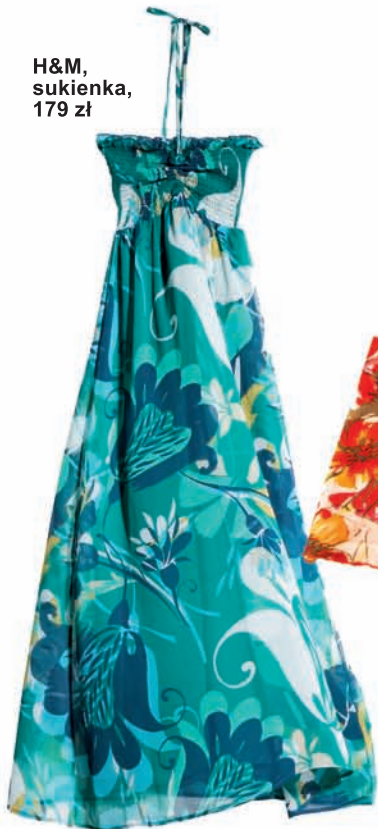
H&M, sukienka, 179 zł