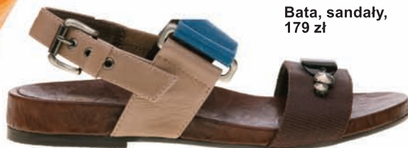
Bata, sandały, 179 zł