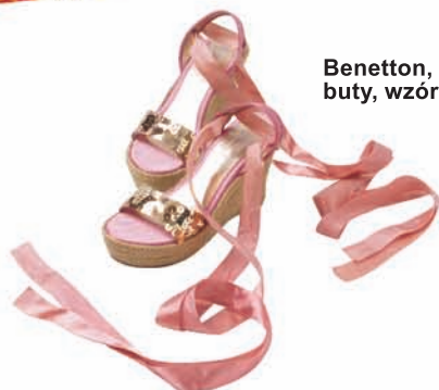
Benetton, buty, wzór