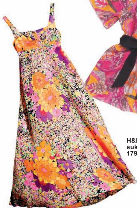
H&M, sukienka, 179 zł