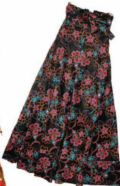
C&A, sukienka, 119zł