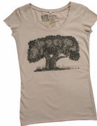
C&A, t-shirt, 34,90 zł