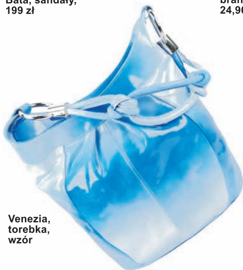
Venezia, torebka, wzór