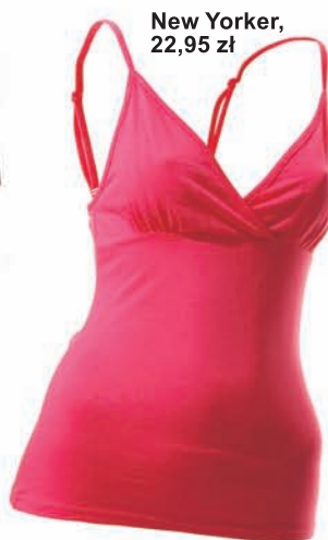
New Yorker, 22,95 zł