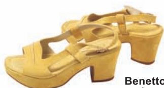
Benetton, buty, wzór