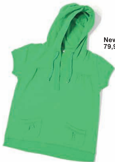
New Yorker, 79,95 zł