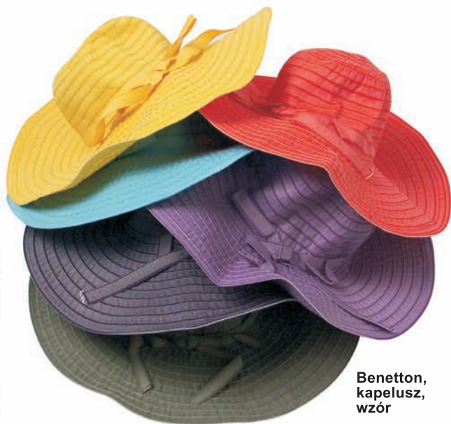
Benetton, kapelusz, wzór