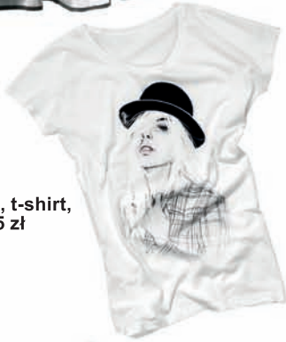
H&M, t-shirt, 59,95 zł

J edno z najmodniejszych połączeń kolorystycznych w historii! Dedykowane Paniom, które nie przepadają za neonowymi barwami i kwiatowymi wzorami. Występuje w wersji eleganckiej – w klasycznych kostiumach, garniturach, biżuterii oraz luźniejszej na t-shirtach, sukienkach, a nawet butach. Ponadczasowe zestawienie dla mniej odważnych.