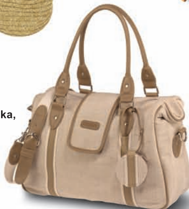
Olsen, torebka, 269 zł