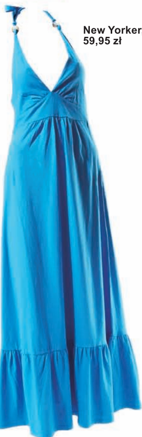
New Yorker, 59,95 zł